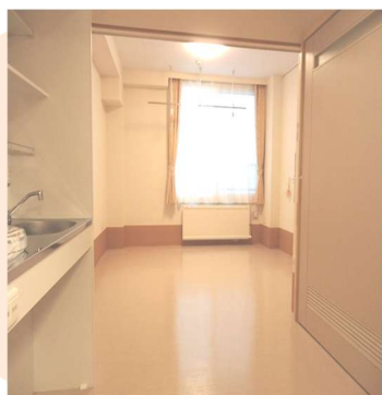
居 室 内