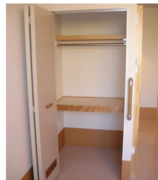
ク ロ ー ゼ ッ ト