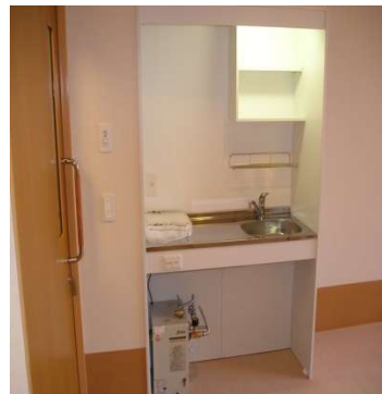
洗 面 コ ー ナ ー