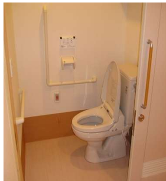
ト イ レ