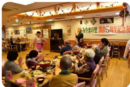
ホール（行事催し時）

各居室にはトイレ、ミニクローゼット、洗面所があります。食堂、浴室は共同利用となります。